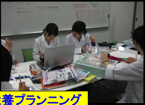
中心静脈栄養プランニング