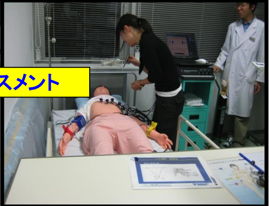
フィジカルアセスメント