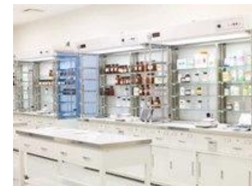
模擬病院薬局 調剤室 (散剤)