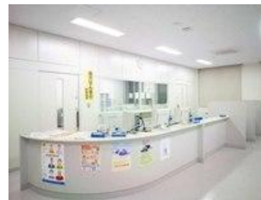
模擬病院薬局 調剤室 (錠剤・鑑査)